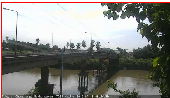
สถานีทับกฤช ต.ทับกฤชใต้ อ.ชุมแสง จ.นครสวรรค์ (ลุ่มน้ำเจ้าพระยา)