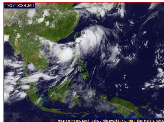
ภาพถ่ายจากดาวเทียม วันที่ 18 ก.ค. 2562