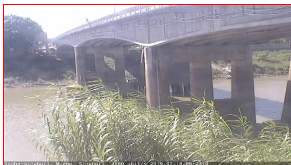
สถานีเชิงสะพานสิงห์บุรี ต.บางมัญ อ.เมือง จ.สิงห์บุรี (ลุ่มน้ำเจ้าพระยา)