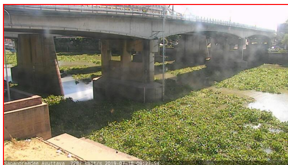
สถานีสะพานปรีดี-ธำรง ต.หัวรอ อ.พระนครศรีอยุธยา จ.พระนครศรีอยุธยา (ลุ่มน้ำเจ้าพระยา)