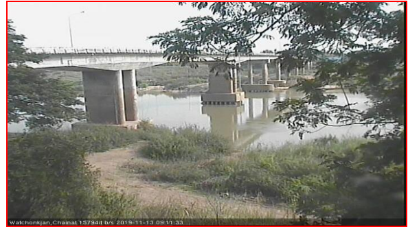
สถานีวัดโคกจันทร์ ต.โพนางดำ อ.สรรพยา จ.ชัยนาท (ลุ่มน้ำเจ้าพระยา)