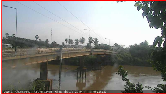
สถานีทักถุช ต.ทักถุชใต้ อ.ชุมแสง จ.นครสวรรค์ (ลุ่มน้ำเจ้าพระยา)