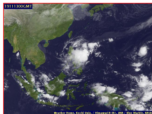
ภาพถ่ายจากดาวเทียม วันที่ 13 พ.ย. 2562