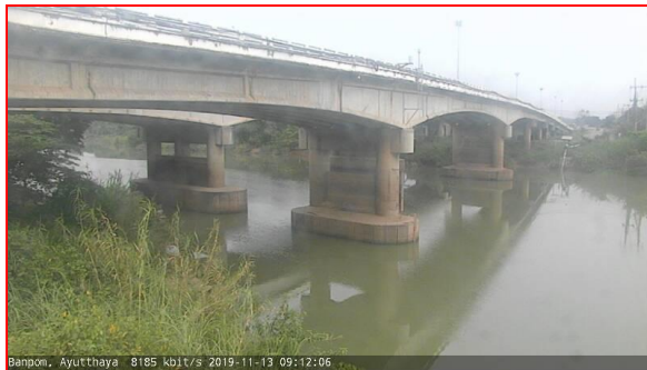
สถานีบ้านป้อม ต.บ้านป้อม อ.เมือง จ.พระนครศรีอยุธยา (ลุ่มน้ำเจ้าพระยา)