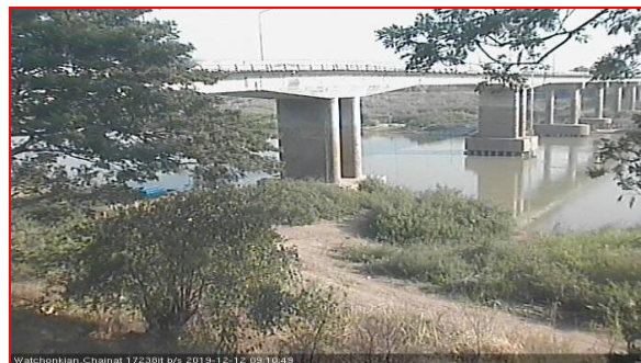
สถานีวัดโคกจันทร์ ต.โพนางคำ อ.สรรพยา จ.ชัยนาท (ลุ่มน้ำเจ้าพระยา)