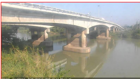
สถานีบ้านป้อม ต.รามัญ อ.เมือง จ.พระนครศรีอยุธยา (ลุ่มน้ำเจ้าพระยา)