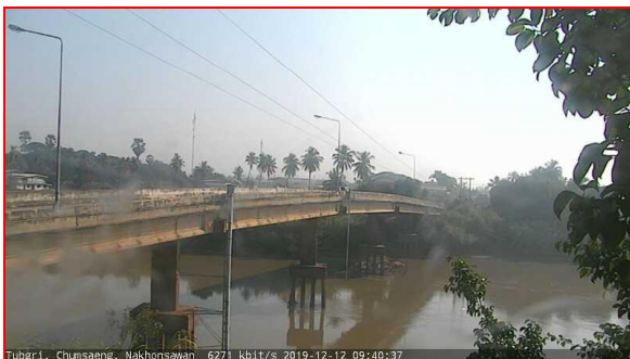
สถานีทับกฤช ต.ทับกฤชใต้ อ.ชุมแสง จ.นครสวรรค์ (ลุ่มน้ำเจ้าพระยา)