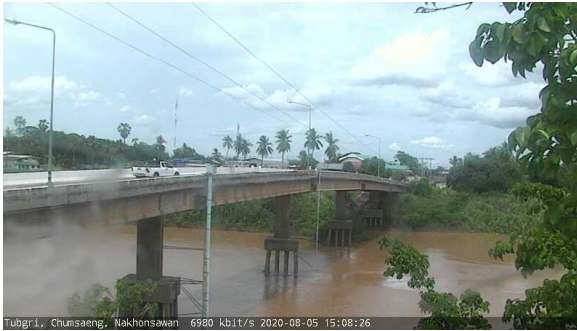
สถานีทับกฤช ต.ทับกฤชใต้ อ.ชุมแสง จ.นครสวรรค์ (ลุ่มน้ำเจ้าพระยา)