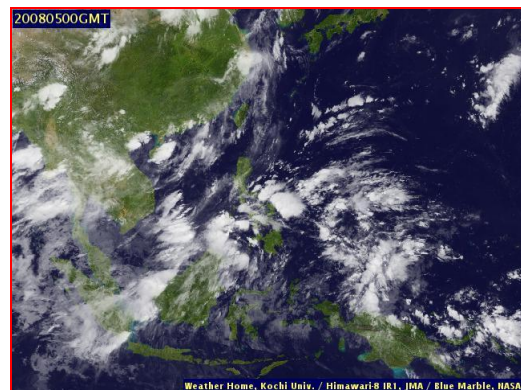
ภาพถ่ายจากดาวเทียม วันที่ 5 ส.ค. 2563