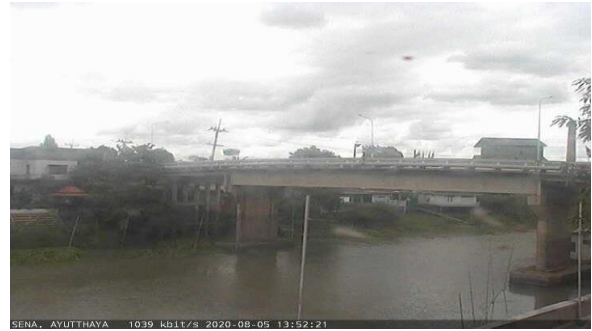
สถานีเสนา ต.เสนา อ.เสนา จ.พระนครศรีอยุธยา (ลุ่มน้ำเจ้าพระยา)