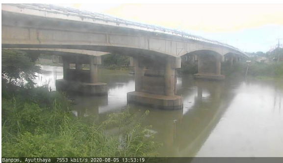
สถานีบ้านป้อม ต.บ้านป้อม จ.พระนครศรีอยุธยา (ลุ่มน้ำเจ้าพระยา)