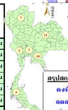
สรุปสถานการณ์ปริมาณน้ำในอ่างฯ