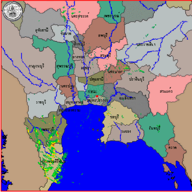
สถานีสุวรรณภูมิ เวลา ๐๑.๓๐ น.