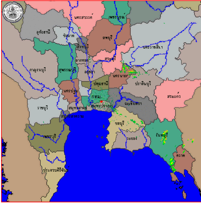
สถานีสุวรรณภูมิ เวลา ๐๘.๓๐ น.