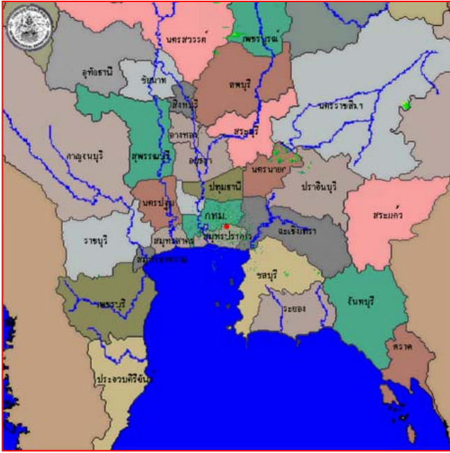
สถานีสุวรรณภูมิ เวลา ๐๘.๓๐ น.