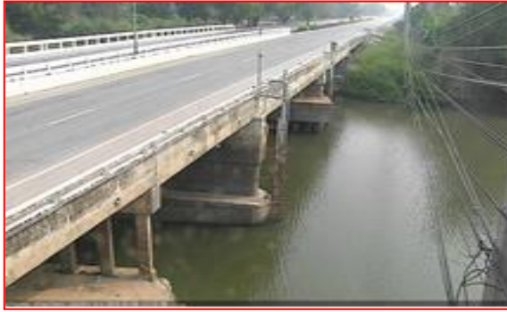
สถานีอุทัยใหม่ อ.เมือง จ.อุทัยธานี (ลุ่มน้ำเจ้าพระยา)