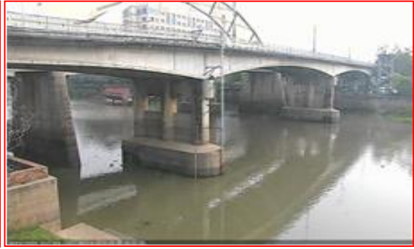
สถานีสะพานปรีดี-ธำรง ต.หัวรอ อ.พระนครศรีอยุธยา จ.พระนครศรีอยุธยา (ลุ่มน้ำเจ้าพระยา)