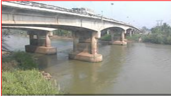
สถานีบ้านป้อม ต.บ้านป้อม อ.พระนครศรีอยุธยา จ.พระนครศรีอยุธยา (ลุ่มน้ำเจ้าพระยา)