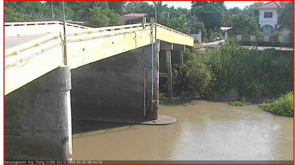
สถานีบ้านยางมณี ต.องครักษ์ อ.โพธิ์ทอง จ.อ่างทอง (ลุ่มน้ำเจ้าพระยา)