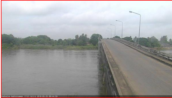
สถานีหาดเสลา ต.หัวดง อ.เก้าเลี้ยว จ.นครสวรรค์ (ลุ่มน้ำเจ้าพระยา)