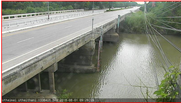
สถานีอุทัยใหม่ ต.สะแกกรัง อ.เมือง จ.อุทัยธานี (ลุ่มน้ำเจ้าพระยา)