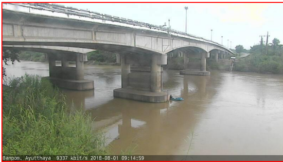
สถานีบ้านป้อม ต.บ้านป้อม อ.พระนครศรีอยุธยา จ.พระนครศรีอยุธยา (ลุ่มน้ำเจ้าพระยา)