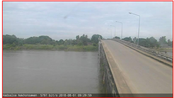
สถานีบ้านหาดเสลา ต.หัวดง อ.เก้าเลี้ยว จ.นครสวรรค์ (ลุ่มน้ำเจ้าพระยา)