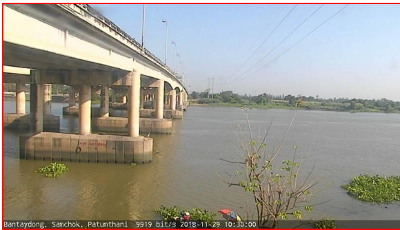
สถานีบ้านท้ายดง ต.บางกระบือ อ.สามโคก จ.ปทุมธานี (ลุ่มน้ำเจ้าพระยา)