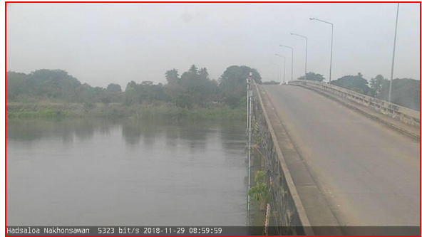
สถานีบ้านหาดเสลา ต.หัวดง อ.เก้าเลี้ยว จ.นครสวรรค์ (ลุ่มน้ำเจ้าพระยา)