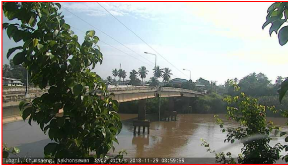
สถานีทับทิมใต้ ต.ทับทิมใต้ อ.ชุมแสง จ.นครสวรรค์ (ลุ่มน้ำเจ้าพระยา)