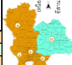
สรุปสถานการณ์ปริมาณน้ำในอ่างน้ำ