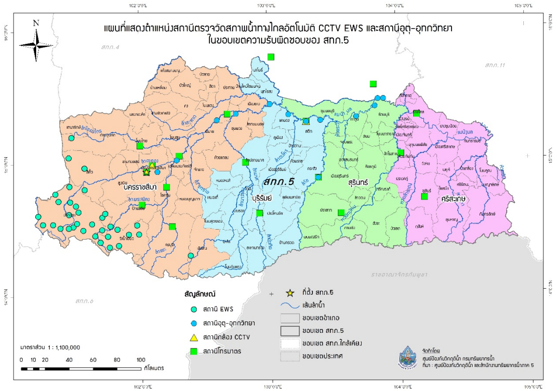
รูปที่ 4 ตำแหน่งสถานีตรวจวัดสถานการณ์น้ำ ในเขตพื้นที่ความรับผิดชอบของ สำนักงานทรัพยากรน้ำภาค 5