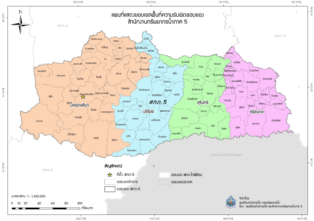
รูปที่ 1 ขอบเขตพื้นที่ความรับผิดชอบของสำนักงานทรัพยากรน้ำภาค 5