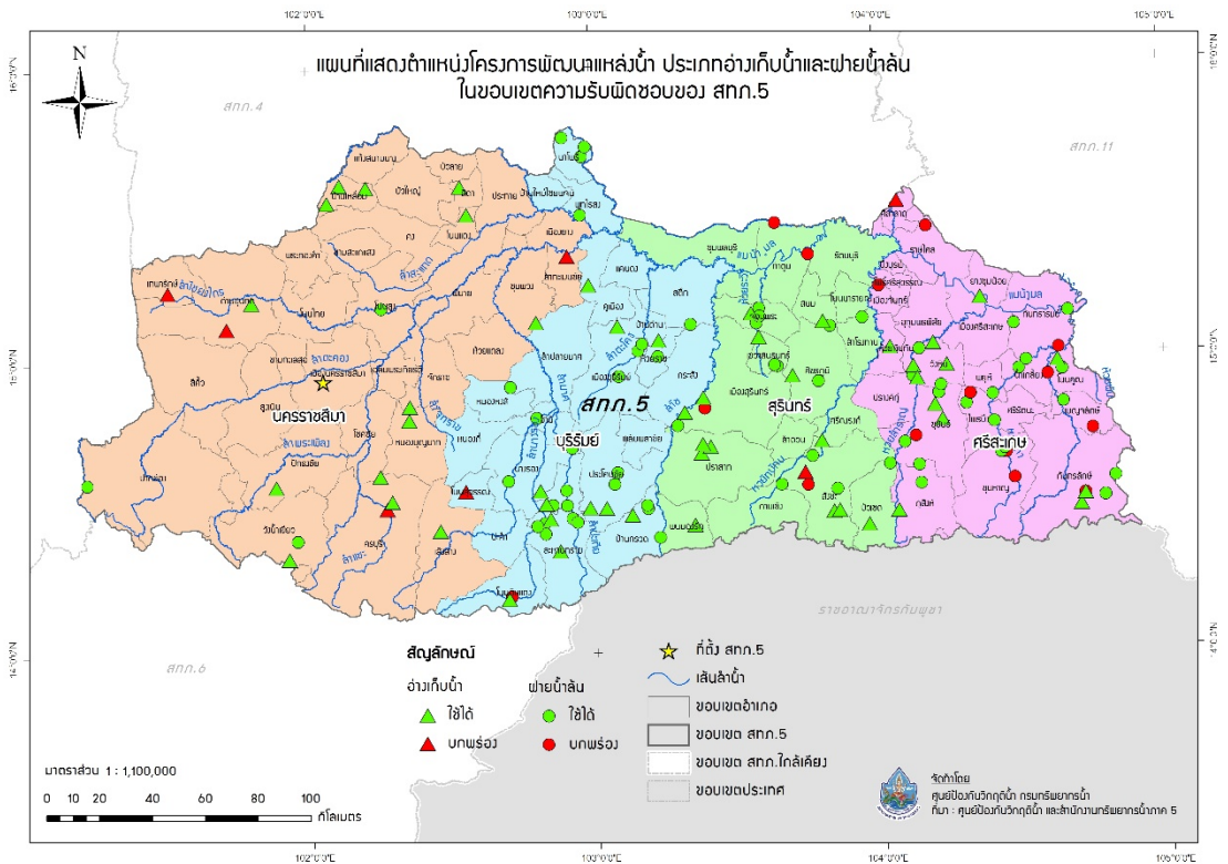
รูปที่ 5 ตำแหน่งโครงการพัฒนาแหล่งน้ำประเภทอ่างเก็บน้ำและฝายน้ำล้น ในเขตพื้นที่ความรับผิดชอบของสำนักงานทรัพยากรน้ำภาค 5