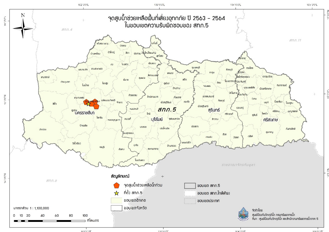
รูปที่ 6 ตำแหน่งจุดติดตั้งเครื่องสูบน้ำช่วยเหลือน้ำท่วม ช่วงเดือนมิถุนายน - ธันวาคม ในเขตพื้นที่ความรับผิดชอบของสำนักงานทรัพยากรน้ำภาค 5