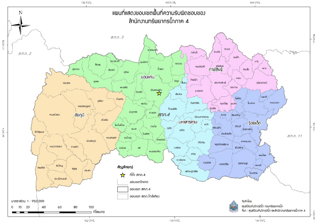
รูปที่ 1 ขอบเขตพื้นที่ความรับผิดชอบของสำนักงานทรัพยากรน้ำภาค 4