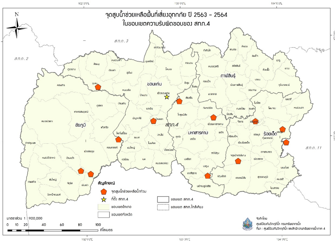
รูปที่ 6 ตำแหน่งจุดติดตั้งเครื่องสูบน้ำ ช่วยเหลือน้ำท่วมช่วงเดือนมิถุนายน - ธันวาคม ในเขตพื้นที่ความรับผิดชอบของสำนักงานทรัพยากรน้ำภาค 4