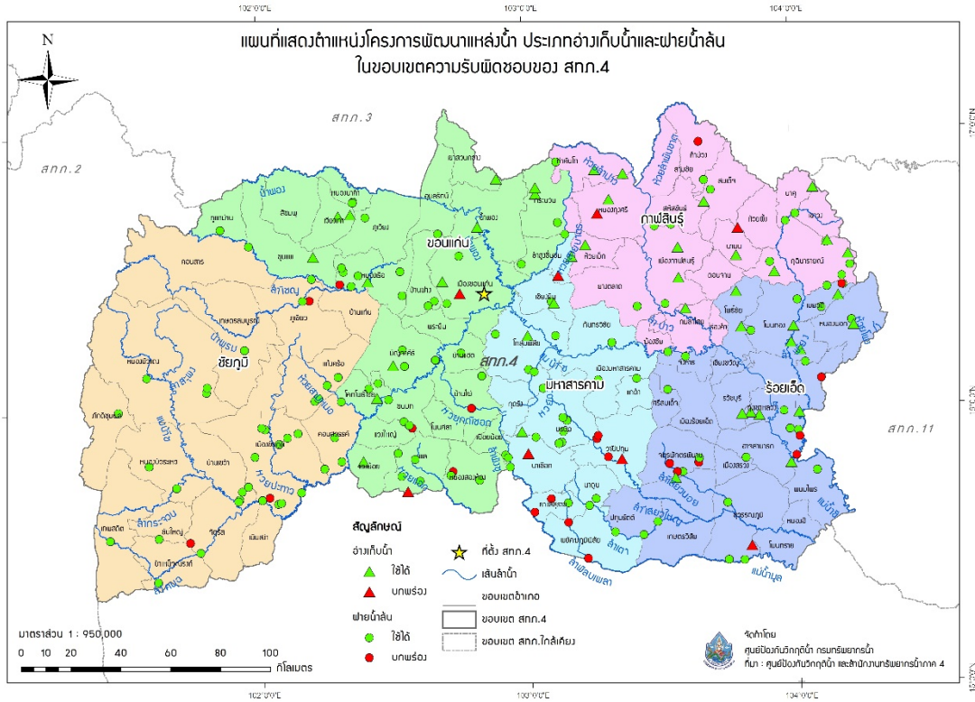
รูปที่ 5 ตำแหน่งโครงการพัฒนาแหล่งน้ำประเภทอ่างเก็บน้ำและฝายน้ำล้น ในเขตพื้นที่ความรับผิดชอบของสำนักงานทรัพยากรน้ำภาค 4