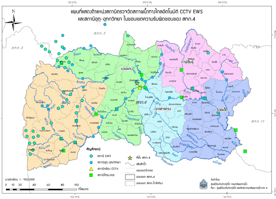
รูปที่ 4 ตำแหน่งสถานีตรวจวัดสภาพน้ำทางไกลอัตโนมัติ CCTV EWS และสถานีอุตุ-อุทกวิทยา ในเขตพื้นที่ความรับผิดชอบของสำนักงานทรัพยากรน้ำภาค 4