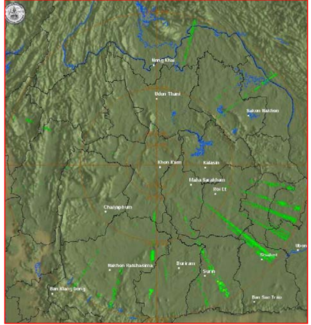
สถานีขอนแก่น เวลา ๐๘.๕๕ น.

จากเรดาร์ตรวจอากาศจะพบว่า มีกลุ่มเมฆฝนกระจายบริเวณภาคกลาง ภาคตะวันออก และภาคตะวันออกเฉียงเหนือ