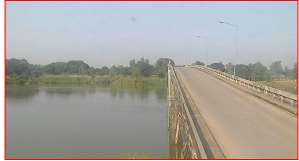
สถานีบ้านหาดเสลา ต.หัวดง อ.เก้าเลี้ยว จ.นครสวรรค์ (ลุ่มน้ำเจ้าพระยา)