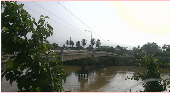
สถานีทับกฤช ต.ทับกฤชใต้ อ.ชุมแสง จ.นครสวรรค์ (ลุ่มน้ำเจ้าพระยา)