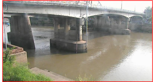
ปริมาณน้ำในลำน้ำของคลองต่างๆ ในพื้นที่ลุ่มน้ำเจ้าพระยา