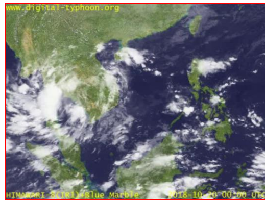
ภาพถ่ายจากดาวเทียม วันที่ 20 ต.ค. 2561