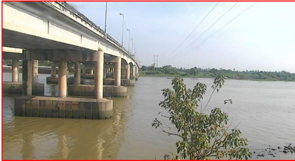
สถานีบ้านท้ายดง ต.บางกระบือ อ.สามโคก จ.ปทุมธานี (ลุ่มน้ำเจ้าพระยา)