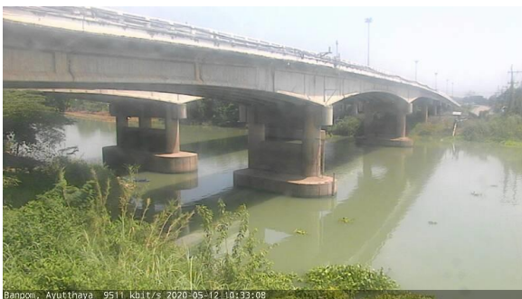
สถานีบ้านป้อม ต.บ้านป้อม จ.พระนครศรีอยุธยา (ลุ่มน้ำเจ้าพระยา)