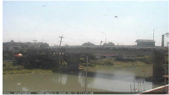
สถานีเสนา ต.เสนา อ.เสนา จ.พระนครศรีอยุธยา (ลุ่มน้ำเจ้าพระยา)