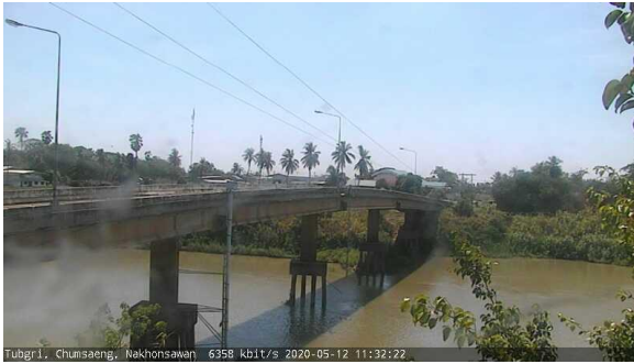
สถานีทับกฤช ต.ทับกฤชใต้ อ.ชุมแสง จ.นครสวรรค์ (ลุ่มน้ำเจ้าพระยา)